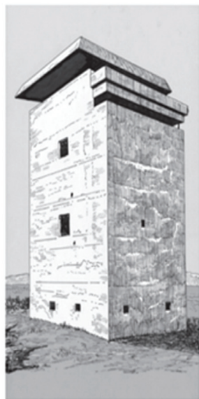
German Second World War fire control concrete bunker. This impressive type S487 (nicknamed 'Barbara') control bunker was located near Bayonne in southern France.