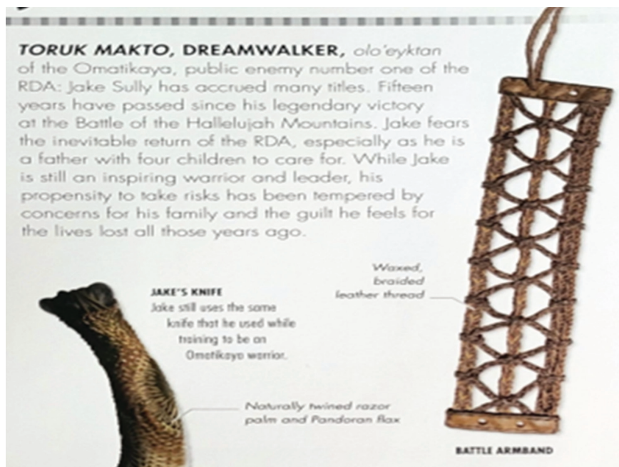
Рис. 8 / Fig. 8. Примеры словарных статей к лексемам, связанным с Джейком Салли / Examples of dictionary entries for lexical units connected with Jake Sully

Каждый раздел словаря включает подробную энциклопедическую справку об определённых явлениях, событиях или героях франшизы «Аватар». Рассмотрим пример организации микроструктуры , посвящённой главному герою фильма Джейку Салли. Словарная статья делится на несколько частей: жизнь на Земле до момента пребывания на планете Пандора, когда герой служил военным, и жизнь после на планете Пандора, когда он стал оператором аватара, а впоследствии вождём клана На'ви Оматикайя. Кроме того, в словарной статье приводится краткий биографический файл в виде таблицы. Микроструктура включает дефиницию, фото персонажа, а также изображения основных предметов, ассоциирующихся с героем (см. рис. 8, 9).