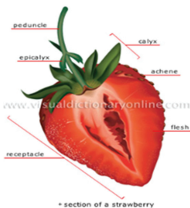
Рис. 13 / Fig. 13. Пример графического изображения к словосочетанию section of a strawberry / Example of a dictionary entry for a word combination section of a strawberry

Введение графических иллюстраций в микроструктуру в отдельных случаях имеет непосредственную учебную направленность: например, в представленном на рис. 15 случае графические