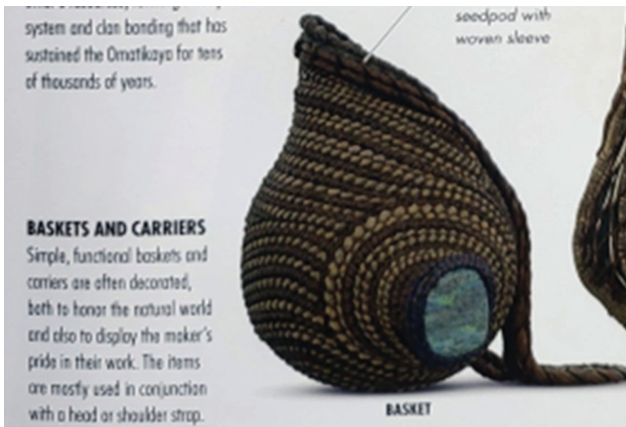
Рис. 11 / Fig. 11. Пример словарной статьи к лексемам baskets and carriers / Example of a dictionary entry for lexical units baskets and carriers