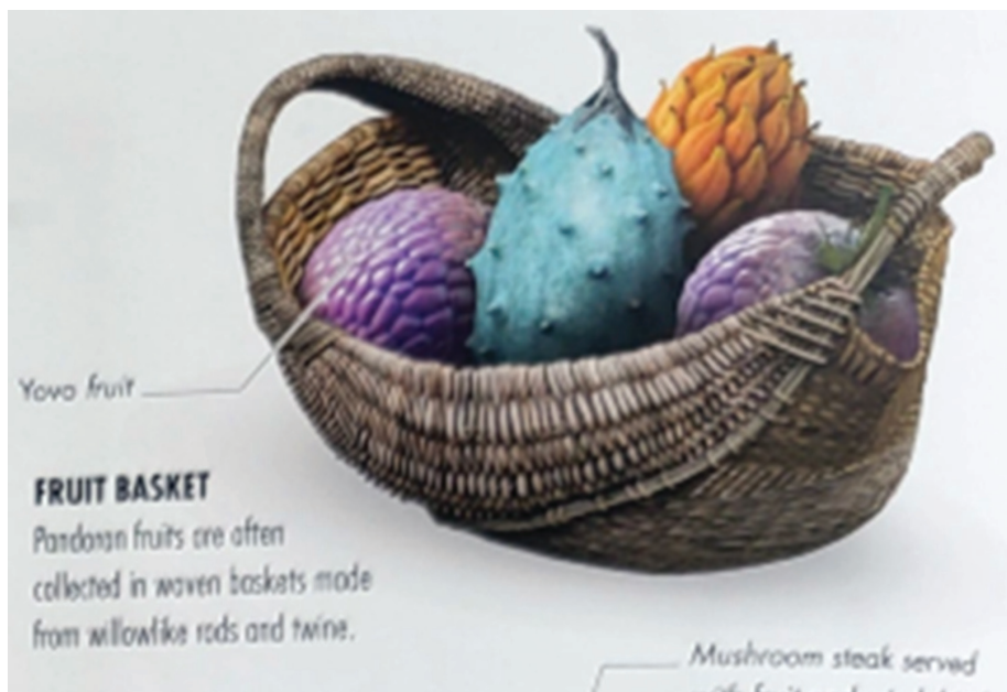
Рис. 10 / Fig. 10. Пример словарной статьи к словосочетанию fruit basket / Example of a dictionary entry for a word combination fruit basket