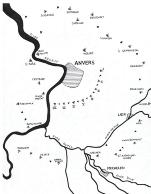
Polygonal forts around Antwerp (Antwerp in Belgium).

Ещё одной категорией специальных словарей становятся издания, в которых