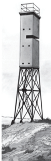
US World War Two fire control station at San Juan in Puerto Rico.

Рис. 4 / Fig. 4. Пример словарной статьи к входной единице fire control station / Example of a dictionary entry for a lexical unit fire control station