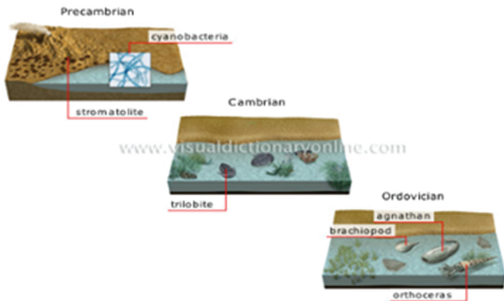
Рис. 15 / Fig. 15. Пример графических изображений, иллюстрирующих происхождение и эволюцию видов / Example of graphic illustrations showing origin and evolution of species.

теля появляется возможность напрямую написать составителям словаря в случаях, если в издании не была найдена необходимая лексическая единица. Кроме того, пользователи могут оставить комментарий относительно той или иной словарной статьи либо внести предложе-