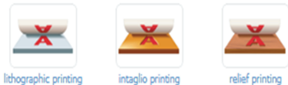
Рис. 14 / Fig. 14. Пример графических изображений типов печати / Example of graphic illustrations for types of printing.