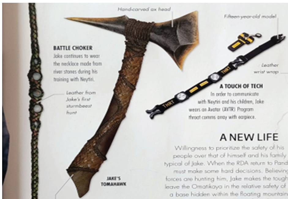
Рис. 9 / Fig. 9. Примеры словарных статей к лексемам, посвящённым Джейку Салли / Examples of dictionary entries for lexical units dedicated to Jake Sully

Источник: Izzo J., et al. Avatar. The Way of Water. The Visual Dictionary. P. 13.